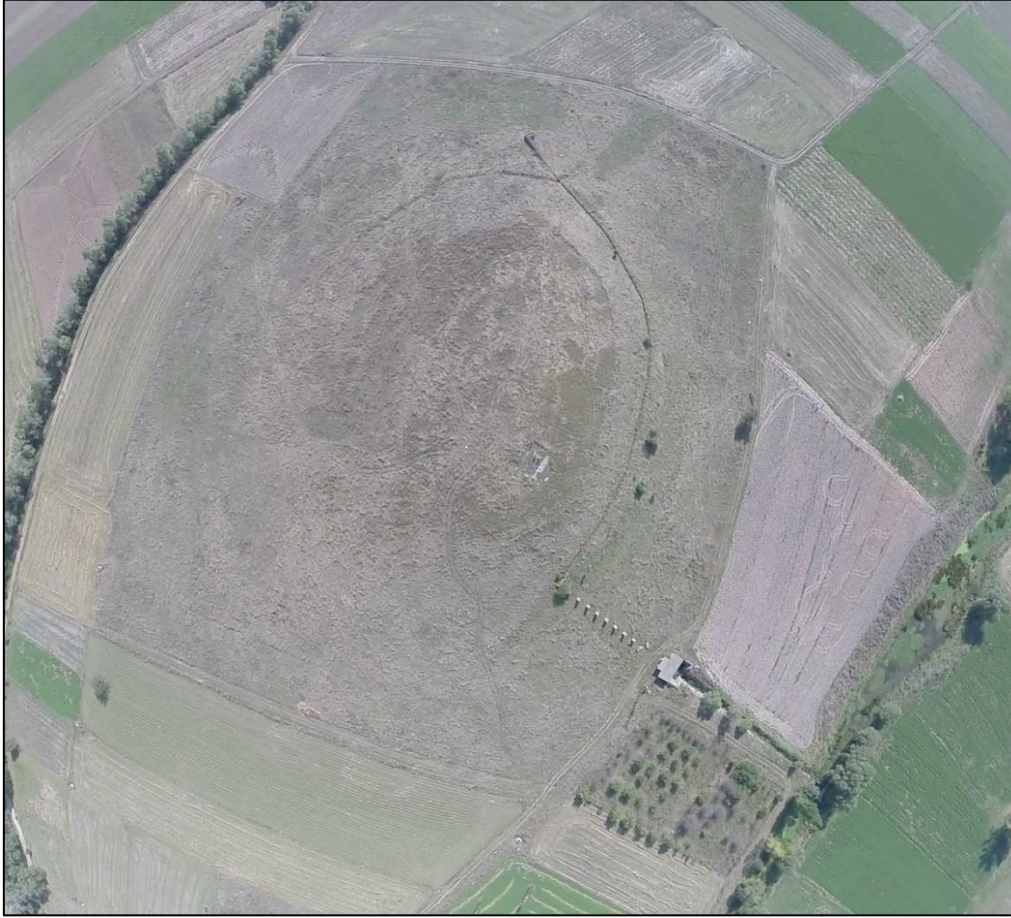
Köprüören Höyük hava fotoğrafı

Kütahya'da diğer önemli bir yerleşme olan Köprüören Höyüğü'nde de araştırmalar gerçekleştirilmiştir. 230 x 210 m ebatlarında olup, ova seviyesinden de 8 m yükseklikteki höyük üzerinde İlk Tunç Çağı, Orta Tunç Çağı ve Roma Dönemi'ne ait çanak çömlek parçaları gözlemlenmiştir. Ayrıca höyük üzerinde çok fazla sayıda metal cürufu ele geçirilmiştir. Ayrıca Kütahya'da Tepecik, Beyköy, Moymul ve Hacıkebir höyükleri de ziyaret edilmiştir.