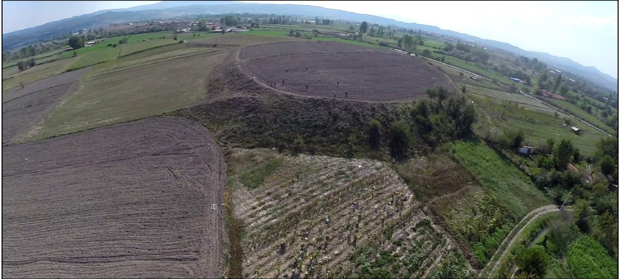
Tavşanlı Höyük, kuzeybatıdan

Kütahya’daki çalışmaların önemli bir kısmı Tavşanlı Höyük üzerinde yoğunlaşmıştır. Belli belirsiz iki koniden oluşan Tavşanlı Höyük, 50 x 50 m karelere bölünerek incelenmiştir. Geç Kalkolitik Dönem’den Geç Tunç Çağı’na kadar, yaklaşık olarak MÖ 3500 ile MÖ 1200 yılları arasında iskan edilmiş olan Tavşanlı Höyüğün güneydoğu kesiminde ise Klasik Dönem malzemesi bulunmuştur. Ayrıca tepe üzerinde çok az da olsa Doğu Roma Dönemi malzemesi bulunmaktadır. Tavşanlı Höyük, daha önce yapılan araştırmaların aksine Batı Anadolu ölçülerine göre çok daha büyük bir yerleşme görünümündedir. Höyük, malzeme dağılımına bakıldığında 650 m x 680 m ebatlarına ulaşmaktadır. Bu duruma göre yaklaşık 44 hektarlık bir yerleşme söz konusudur. Höyük ova seviyesinden de 14 m yüksekliktedir. Ayrıca Tavşanlı Höyük ile Orhaneli Çayı arasında sit alanı dışında kalan kısımda karot sondajları ile de jeoarkeolojik anlamda çok önemli veriler elde edilmiştir.