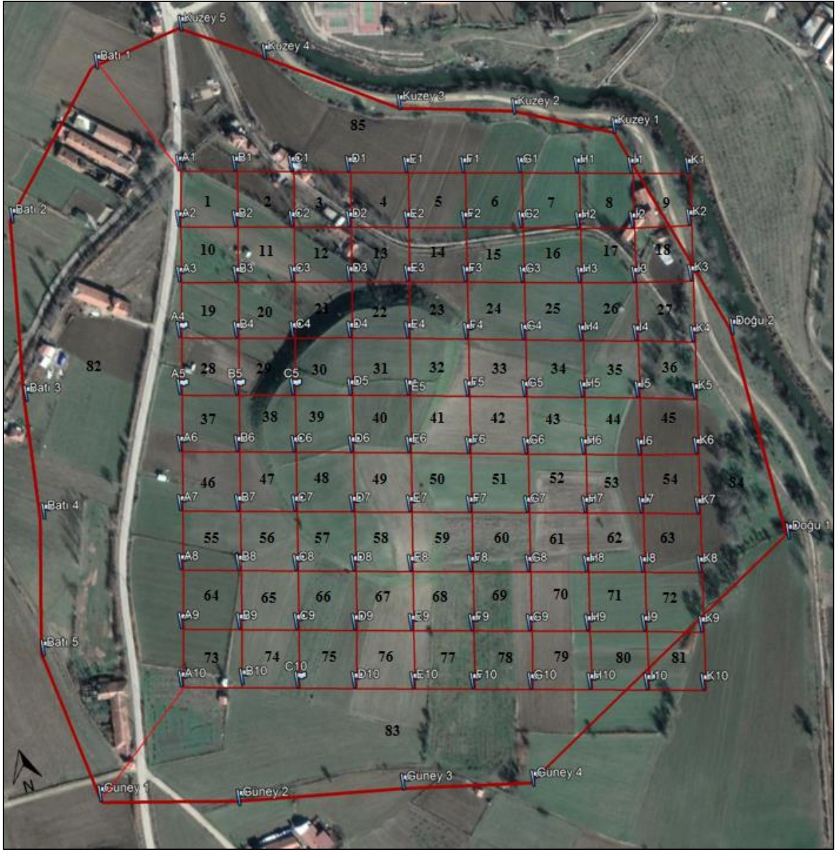
Tavşanlı Höyük intensive survey karelej sistemi ve malzeme dağılımına göre yerleşme dış sınırı (Çizim: F. Karadaş)

Araştırmanın ilk sonuçları, Tavşanlı Höyük'ün, Batı Anadolu'nun en önemli MÖ II. Binyıl yerleşmelerinden bir tanesi olabileceğini göstermiştir. Geç Tunç Çağı'nın yanında özellikle erken Orta Tunç Çağı (Kültepe 2. Tabaka – Erken Koloni Dönemi) yerleşmesi çok güçlü görünmektedir. Yerleşme, bölgedeki kereste, bakır ve gümüş gibi hammadde kaynakların temini ve ticaret ağı çerçevesinde aktarımı için kurulmuş önemli bir kent olabilir. Muhtemelen yerleşme, bu organizasyonu sağlayan yöneticinin oturduğu ve depolamanın yapıldığı yukarı şehir ile işçilerin oturduğu ve üretimin yapıldığı geniş bir aşağı şehirden oluşmaktadır. Büyük oranda yangın geçirdiği anlaşılan yerleşmede hemen pulluk altında yangın geçirmiş MÖ II. Binyıl tabakaları izlenebilmektedir. İleride burada yapılacak arkeolojik kazıların Anadolu